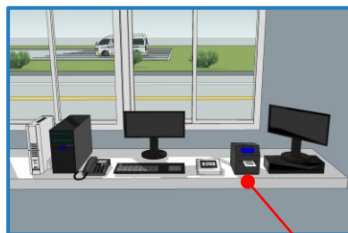
QRコード通行証プリンター